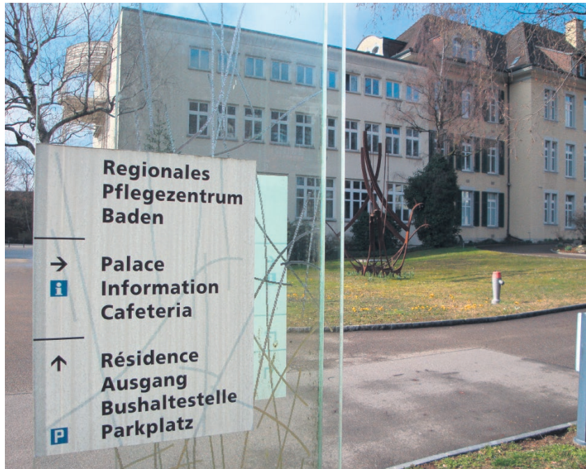
Wer unterstützt mich, wenn ich die Kosten des Pflegeheims nicht mehr bezahlen kann?

bei den Ergänzungsleistungen der Teil des Vermögens (Verzehr), der bei Alleinstehenden CHF 37 500 und bei Ehepaaren CHF 60 000 übersteigt, als Einkommen angerechnet wird?